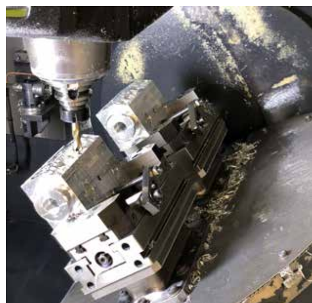
UNA DELLE FASI DEL PROCESSO DI PRODUZIONE